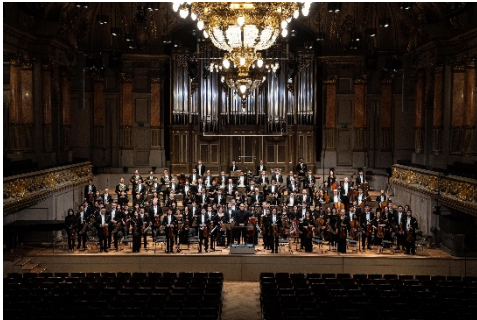
音樂總監梵志登與香港管弦樂團於蘇黎世音樂廳 Tonhalle