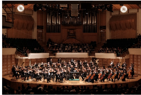
音樂總監梵志登與香港管弦樂團