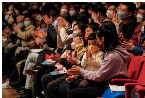
太古社區音樂會