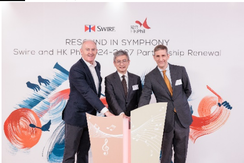
文化體育及旅遊局副局長劉震先生（中）、太古股份有限公司主席白德利先生（左）及香港管弦樂團董事局主席岑明彥先生主持續約儀式（右）